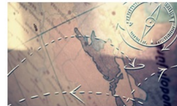
Pilietinis ir politinis raštingumas