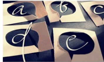
Gimtoji ir valstybinė kalba