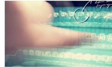
Kompiuterinis ir skaitmeninis raštingumas